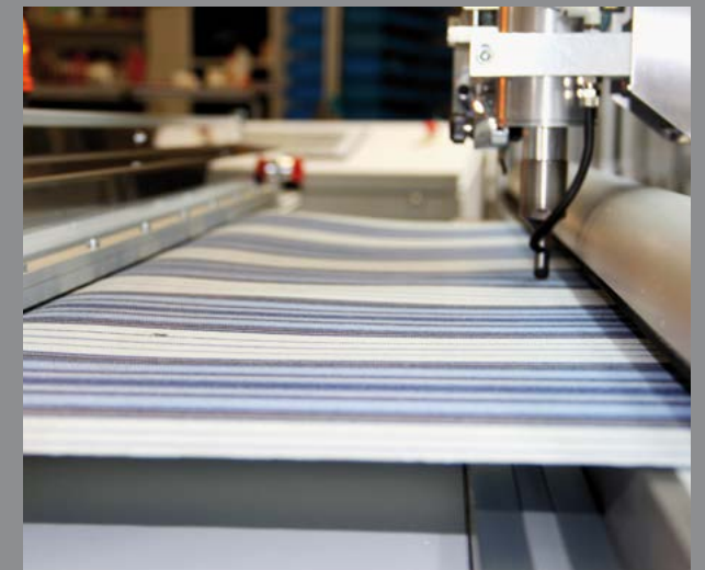
Automatic fabric puller / Estirado del tejido automático