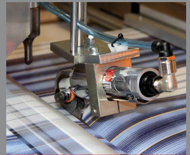
Rotary Blade for cross cutting (with ultrasonic optional) / Cuchilla rotativa para el corte transversal (con ultrasonido opcional)