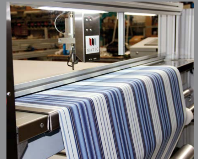
Feeding Device / Mecanismo de alimentación