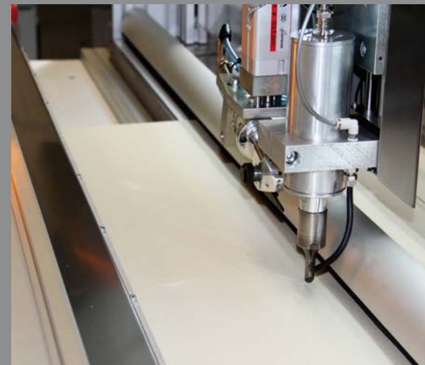
Automatic positioning of the longitudinal cutting tool / Colocación automática de la herramienta de corte longitudinal