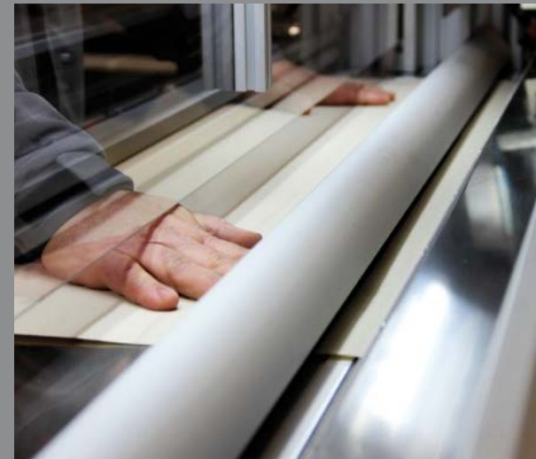
One-time fabric placement only / Colocación del tejido sólo una vez