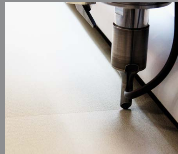
Ultrasonic head to cut and seal the edge simultaneously / Corte por ultrasonido para cortar y sellar el borde al mismo tiempo