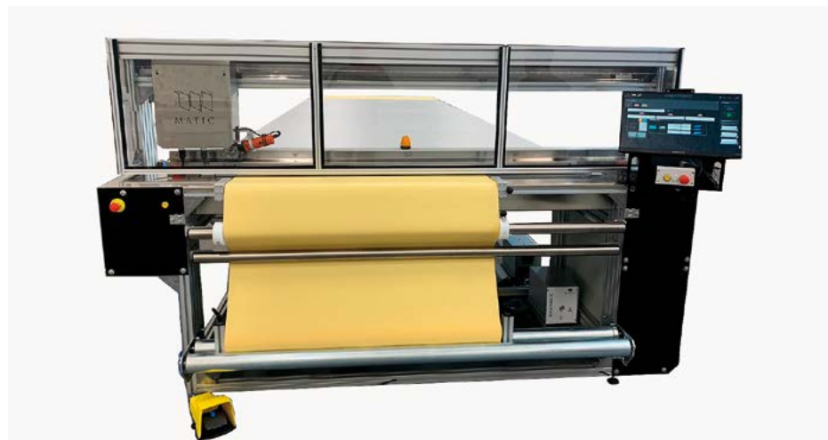
Fabric can be clamped in any position due to M2's dynamic "0" point / El tejido puede colocarse en cualquier posición debido al punto "0" dinámico