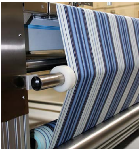
Integrated horizontal roll warehouse / Almacén de rollos horizontal integrado

M2 es una de las máquinas de corte más precisas y rápidas del mercado. La automatización y velocidad de trabajo de la máquina M2 ofrece una medición del ancho del tejido precisa, además de aumentar la capacidad de producción. Su concepción, diseño, y simplicidad de uso hacen de la M2 una de las máquinas más vendidas del mercado. Cálculo automático del corte de tallas, considerando el color del tejido y las medidas finales del toldo ( también en diseños de tejido asimétricos ). La tecnología, innovación y materiales utilizados en su construcción hacen que la M2 sea la perfecta combinación entre eficiencia, precisión y calidad disponible para la fabricación de toldos.