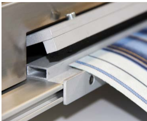
Press bar of the textile / Sistema de fijación del tejido

M2 is one of the most precise and fastest cutting machines on the market . The automation and working speed of the M2 machine provides an accurate measurement of the fabric width, in addition to increased production capacity. The design and ease of use make the M2 one of the best selling machines on the market. Automatic calculation of the cuts takes into consideration stripe patterns, including asymmetric stripes, and final dimensions. Technology, innovation and materials used in its construction, make the M2 the perfect combination of efficiency, accuracy and quality available for manufacturing Awnings.